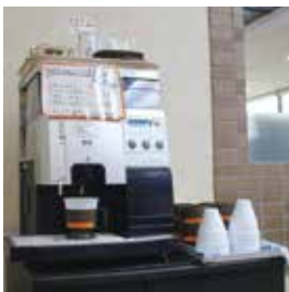
ウェルカムコーヒー 3:00P.M.~11:00P.M.

ゆったりと寛いでいただけるシングルルーム。 あなたのビジネスをサポートするリラックス空間です。 ダブルベッド(140cm幅)やコインランドリー完備など、 長期滞在のお客様にも快適なホテルライフをお届けいたします。