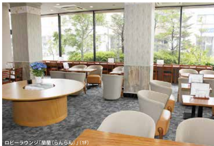
ロビーラウンジ「蘭蘭(らんらん)」(1F)